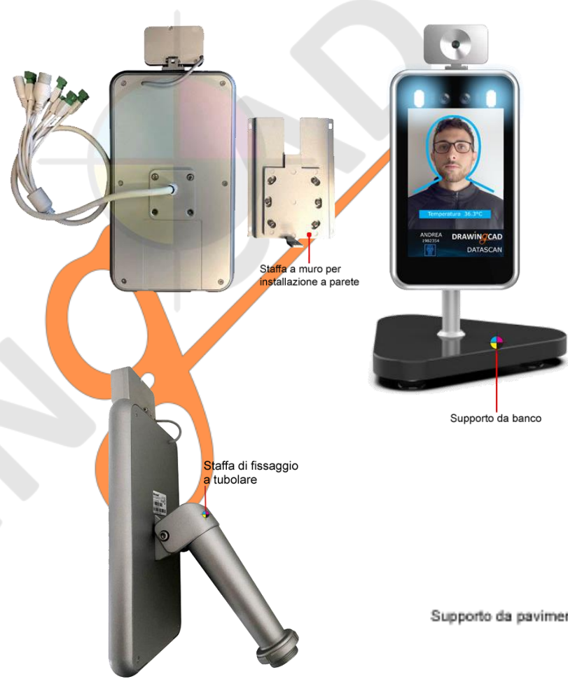
Staffa a muro per installazione a parete