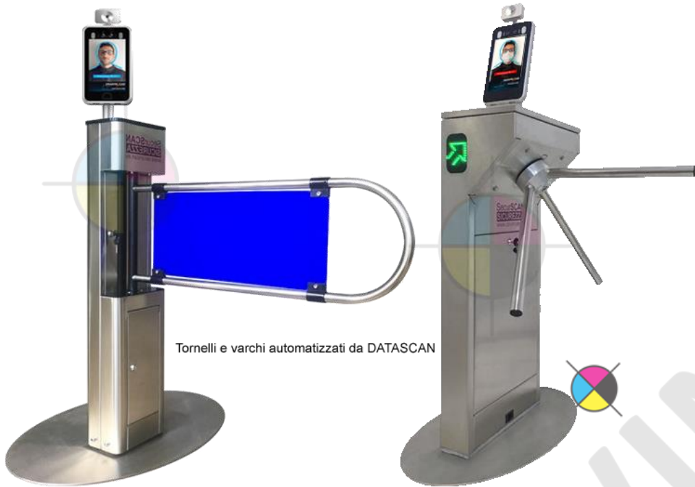
Tornelli e varchi automatizzati da DATASCAN